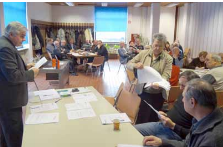
Vodstvo ZDUS pojasnjuje predsednikom in predstavnikom DU ljubljanske pokrajine, kako izpolnjevati obrazce za soglasje v podporo novele zakona o volitvah.

V DZ bi bilo po predlogu zakona neposredno izvoljenih 44 poslancev, torej iz vsakega volilnega okraja po en. Še 44 mandatov pa