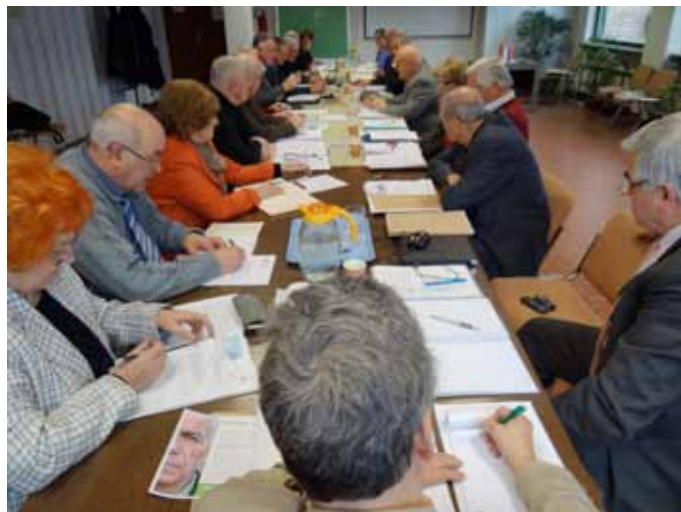
S 13. seje upravnega odbora ZDUS. Več na strani 23.