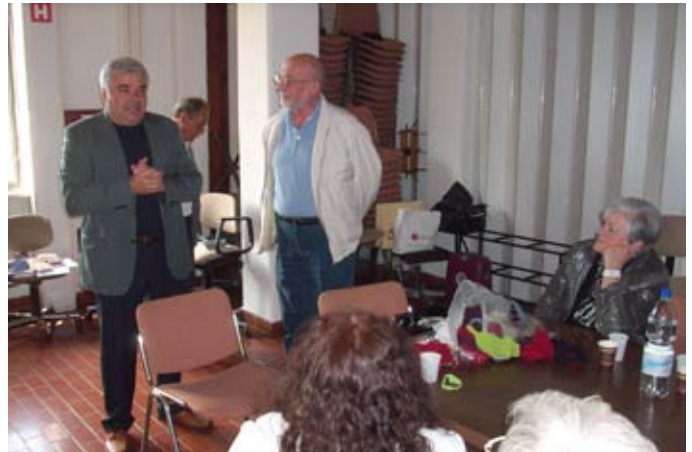
Zagrebski upokojenci obiskali ljubljanske. Več na strani 22.