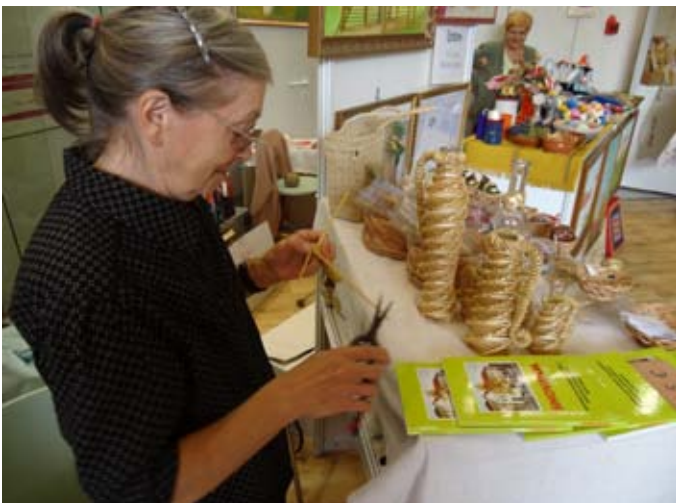
Izdelki iz slame.