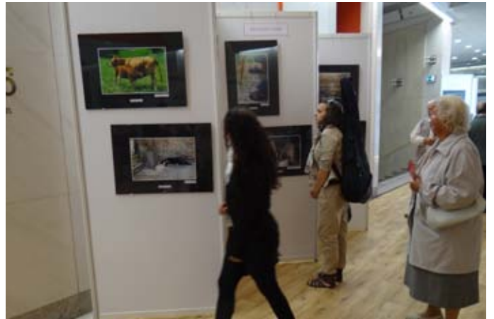
Še en pogled na likovno razstavo.