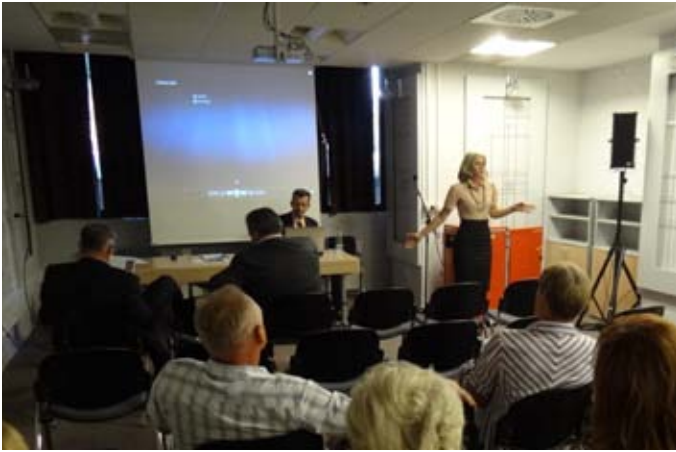
Z ene od dobro obiskanih predstavitev.