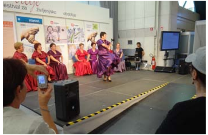
Flamenko po upokojsko.