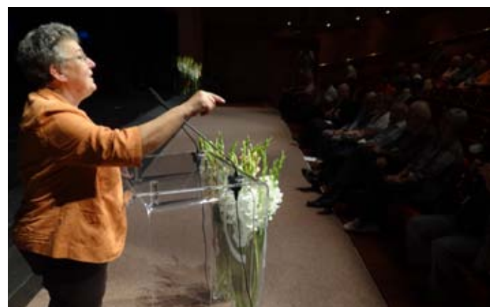
»Naredite nam to deželo prijazno upokojnencem!«