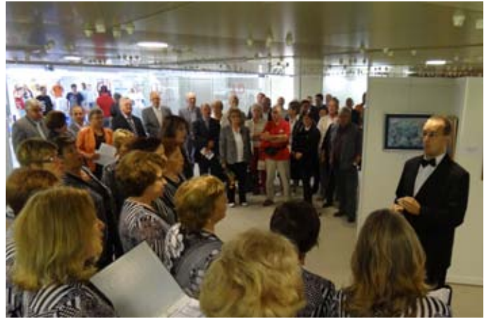
Z otvoritve likovne razstave.