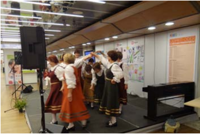
Dekleta so zaplesala.