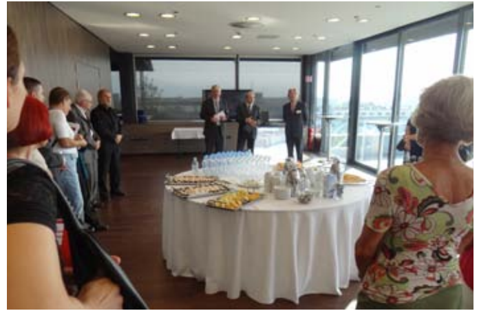
Z ministrom Svetlikom.