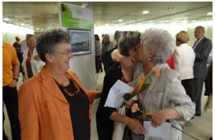
Nagrajenki likovne kolonije v Izoli s predsednico ZDUS.