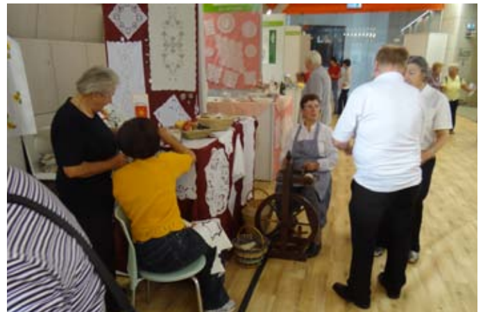
Klekjarici in predilja.