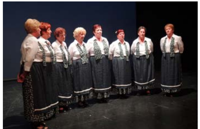
S pevske prireditve.