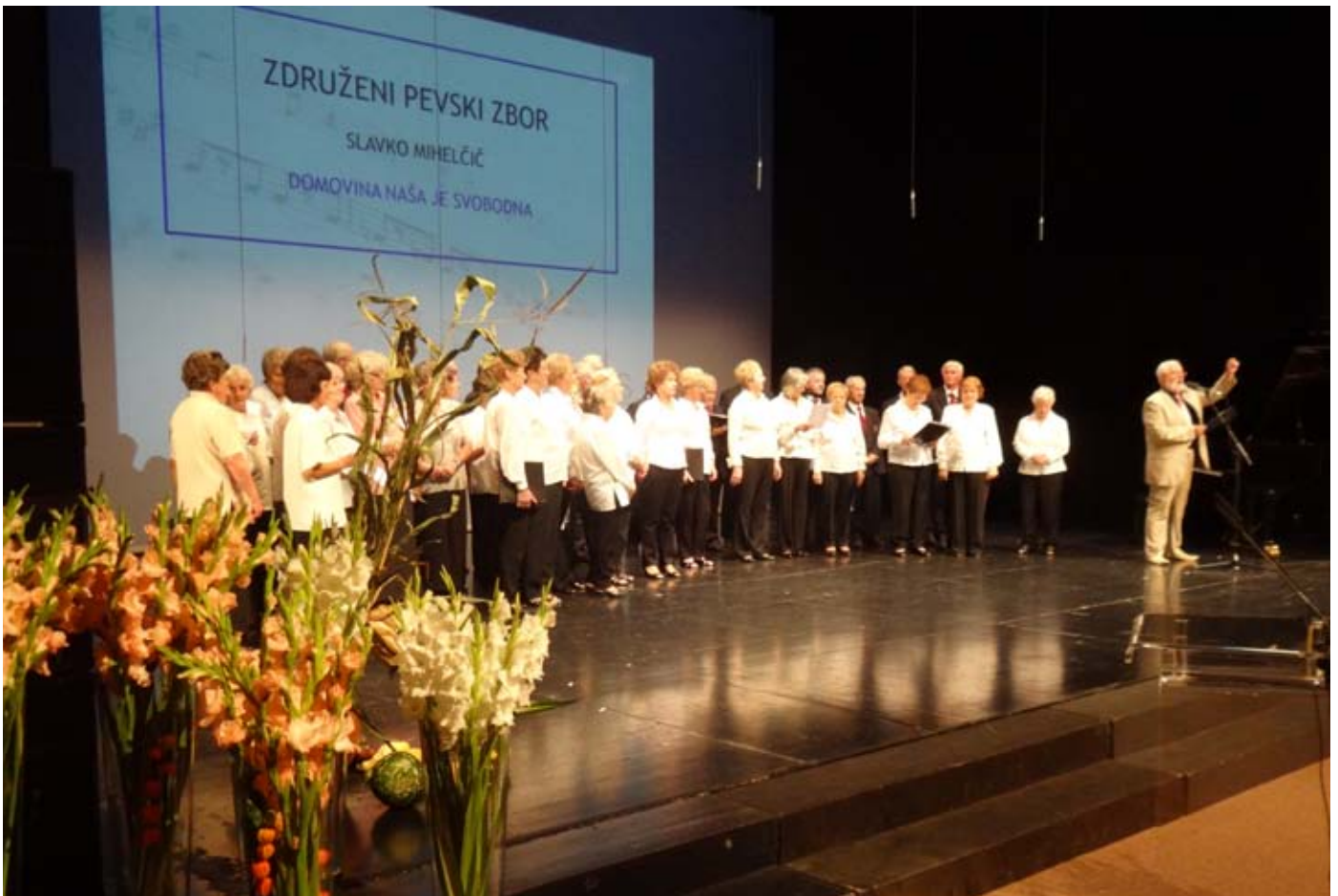
Domovina naša je svobodna.