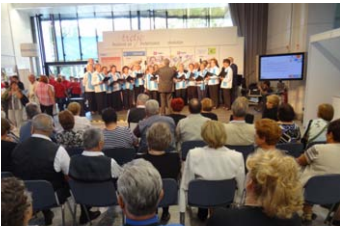
Upokojenke in upokojnenci na odprtem odru.