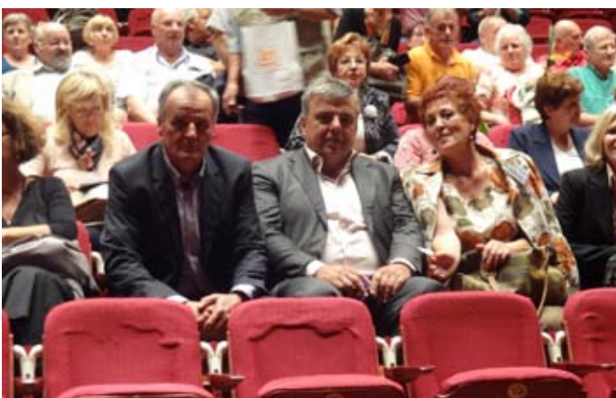
Z otvoritve festivala: gosti iz BiH.