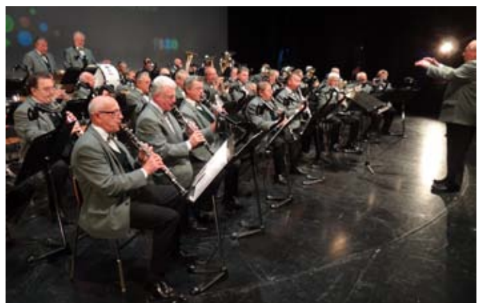
Z otvoritve festivala: Godba ljubljanskih veteranov.