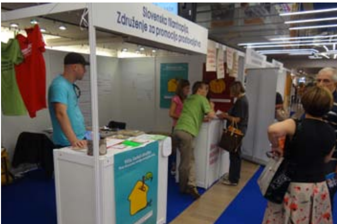
Stojnica Slovenske filantropije.