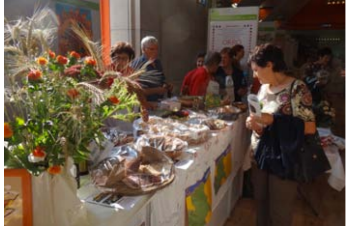
Potice in mesne dobrote.