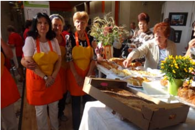
Kuharice s »slanarijami«.