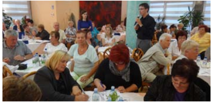
Z enega od dveh srečanj Mreže (stran 7)