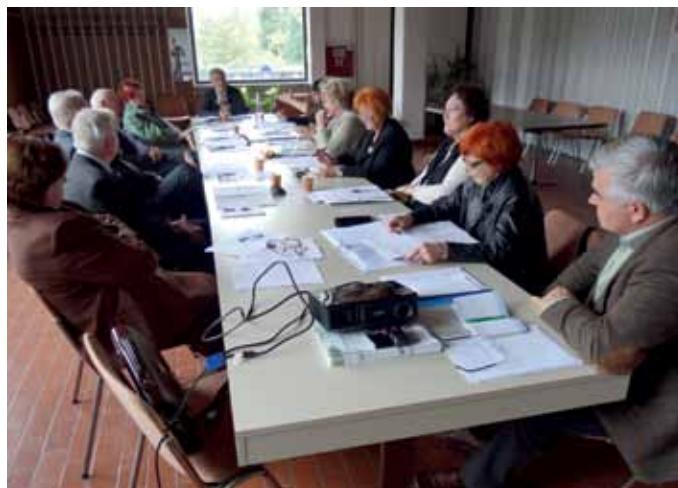
Seja strokovnega sveta