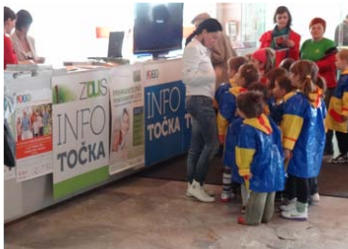
Na festivalu se je ZDUS predstavila z info točko in Zdusovim kotičkom.