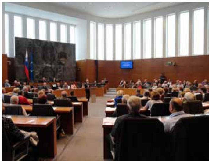
S posvetovanja v Državnem zboru Slovenski zdravstveni sistem pred spremembami. Več na straneh 3 do 9.