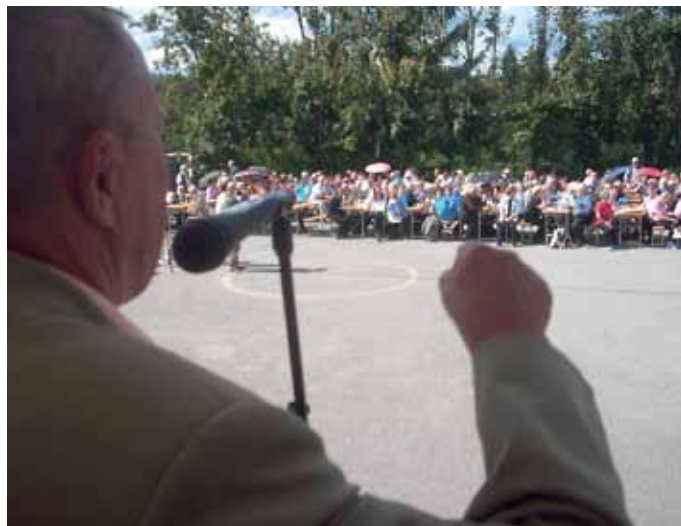
S srečanja notranjskih upokojencev. Več o delu DU str. 10 in 11.