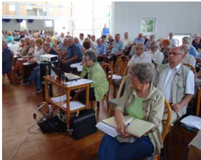
Zbor članov ZDUS. Več na straneh 12 in 13.