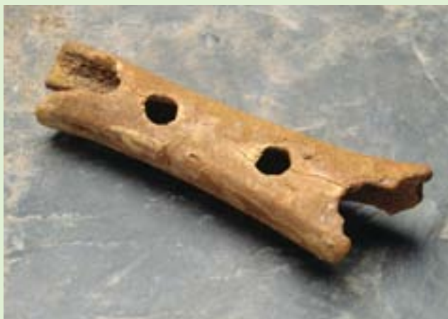
Piščal iz Divjih bab

Pogovor z muzejskim strokovnjakom je brezplačen, starejšim pa za ogled Narodnega muzeja Slovenije nudijo vstopnice po znižani ceni 2,5 evra, ki jih lahko v tekočem mesecu lahko obiskovalci izkoristijo za večkratni obisk.