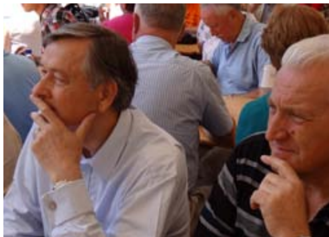
S srečanja upokoјencev na Pokljuki