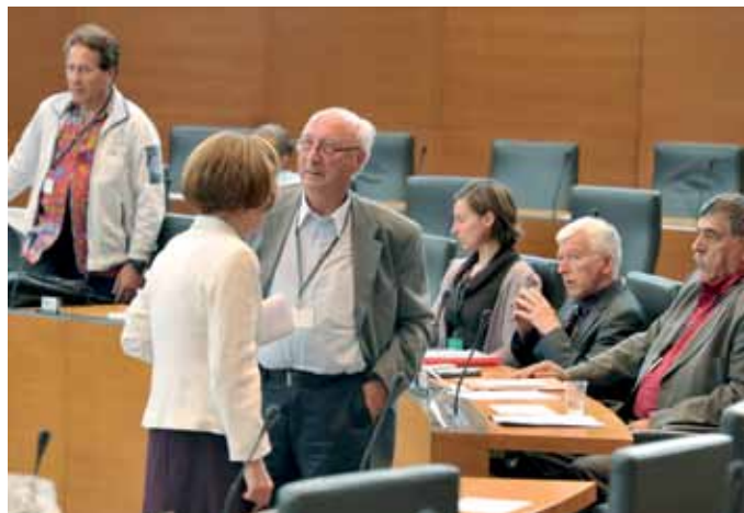
Na javni predstavitvi mnenj o volilnih sistemih, ki je bila 5. maja v državnem zboru, ima med vloženimi zakonskimi predlogi za spremembo volilnega sistema doslej največ podpore kombinirani volilni sistem. Str. 2, 4 in 5