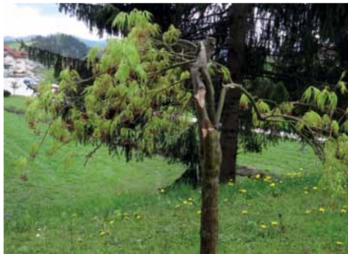
Ne damo se!