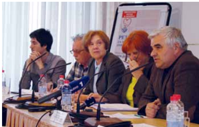
Na tiskovni konferenci so med drugim povedali, da lahko občani prispevajo svoj podpis za ohranitev javnega zdravstva tudi po spletu na www.javno-zdravstvo.si