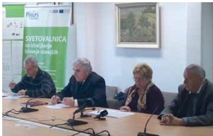
Na tiskovni konferenci ZDUS so strokovnjaki predstavili stališča članov zveze glede pomena zdravja prebivalstva za družbeni in ekonomski razvoj države. Več na str. 3.