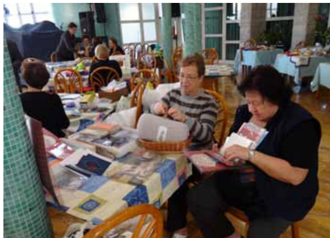
Izdelava voščilnic in drobnih daril. Z delavnice ZDUS v hotelu Delfin. Več str. 19.