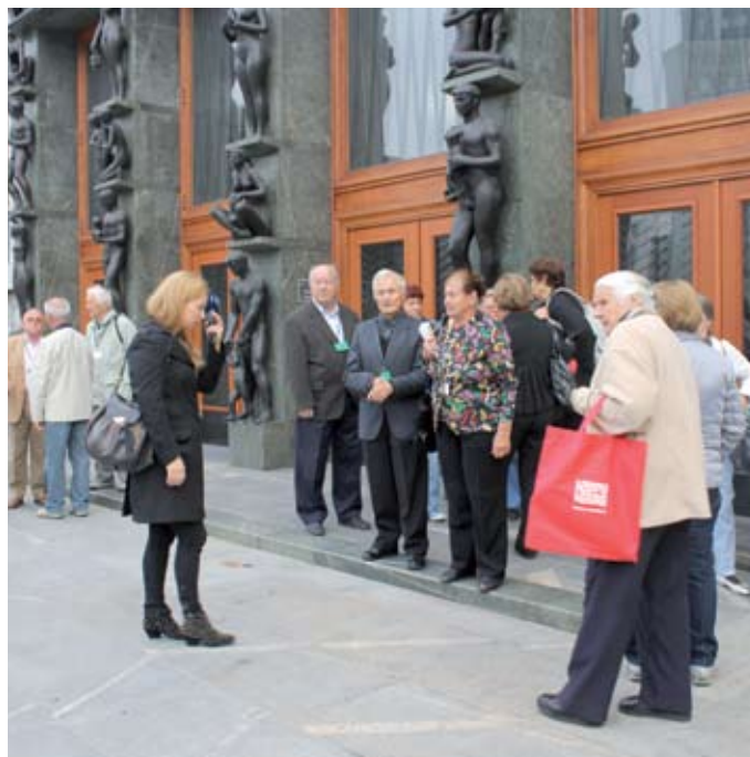
Skupina upokojencev pred pogovorom s poslanci v državnem zboru.