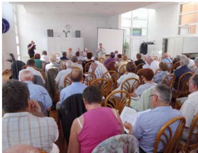
Z zбора članov 17. julija letos v hotelu ZDUS Delfin v Izoli.