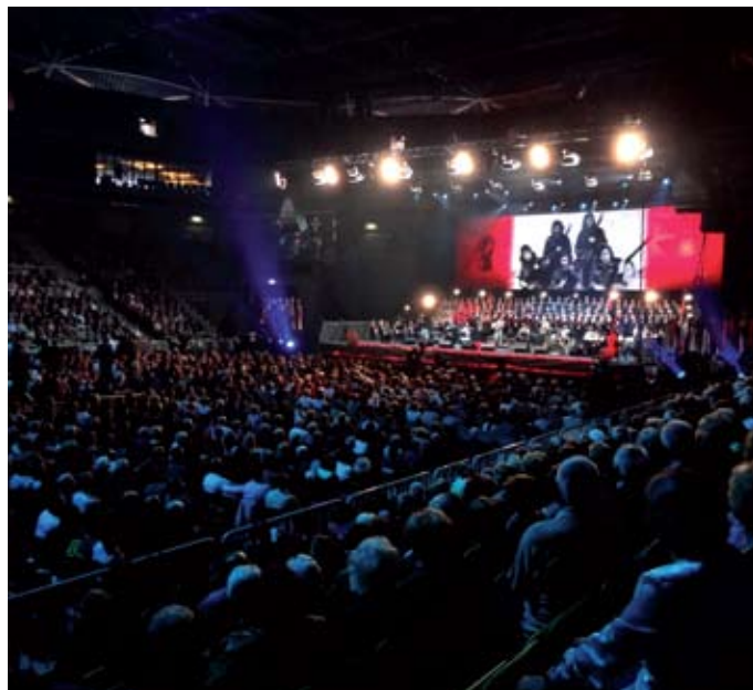
Tako je bila ob državnem prazniku, dnevu upora proti okupatorju na koncertnem večeru pod geslom za svobodo, za kruh, videti polna dvorana Stožice v Ljubljani. Tržaški partizanski pevski zbor Pinko Tomazič je napolnil dvorano, ki sprejme dobrih 12.000 ljudi.