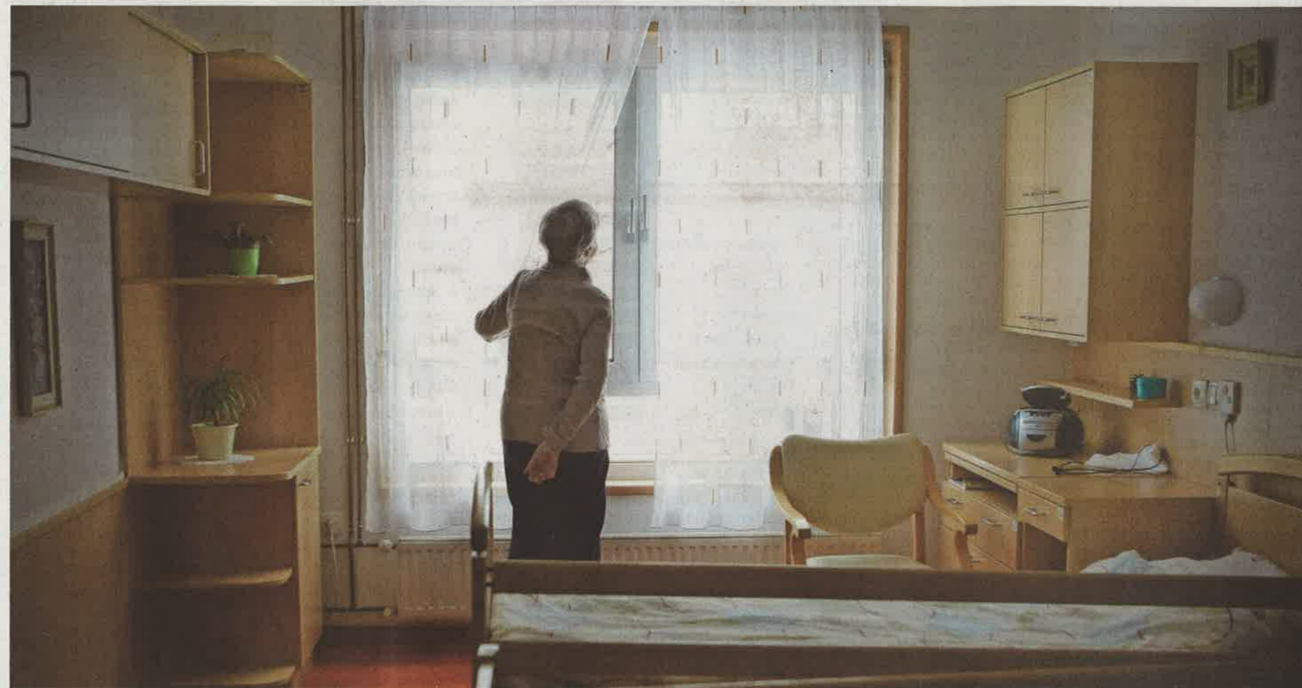
Zaradi pomanjkanja denarja pristojne ustanove v sistem pomoči na domu ne morejo vključevati novih uporabnikov.

delu Slovenije leta 2011 prejelo 768, lani le še 147 upokojencev.