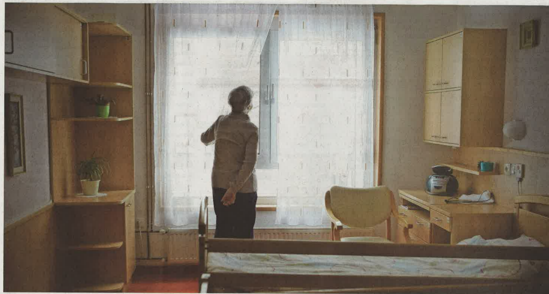
Zaradi pomanjkanja denarja pristojne ustanove v sistem pomoči na domu ne morejo vključevati novih uporabnikov.